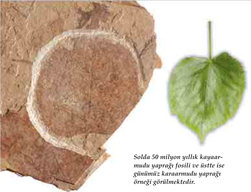
Solda 50 milyon yıllık kayaarmudu yaprağı fosili ve üstte ise günümüz karaarmudu yaprağı örneği görülmektedir.

"Mutasyonların havyanların ve bitkilerin ihtiyaçlarının karşılanmasını sağladığına inanmak, gerçekten çok zordur. Ama Darwinizm bundan fazlasını da ister: Tek bir bitki, tek bir havyan, tam olması gerektiği şekilde binlerce ve binlerce faydalı tesadüfe maruz kalmalıdır. Yani mucizeler sıradan bir kural haline gelmeli, inanılmaz derecede düşük olasılıklara sahip olaylar kolaylıkla gerçekleşmelidir. Hayal kurmayı yasaklayan bir kanun yoktur, ama bilim bu işin içine dahil edilmemelidir." (Pierre-Paul Grassé, Evolution of Living Organisms , s. 103)