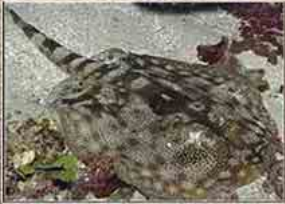
Günümüz denizlerinde görülen dikenli vatoz (solda)